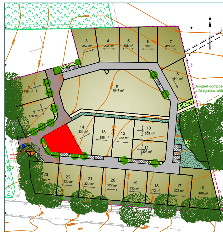
Plan de situation (sans échelle)

LOT N° : 15 Superficie provisoire : 311 m 2 (en attente du bornage)